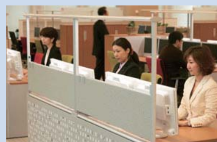
コクヨ梅田ライブオフィス