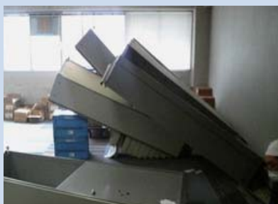
東日本大震災直後 弊社グループ仙台オフィス